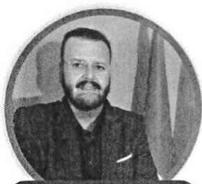
GIUSEPPE FAVILLA SECONDARIA DI SECONDO GRADO

DOCENTI, ATA, INSEGNANTI DI RELIGIONE PER LA SCUOLA